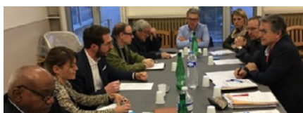
2019, préparation des Journées Interco' Outre-mer accueillies par l'Agglo Hérault-Méditerranée