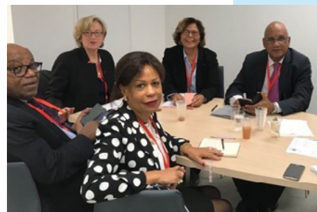
2018, Séance de travail au SGmer