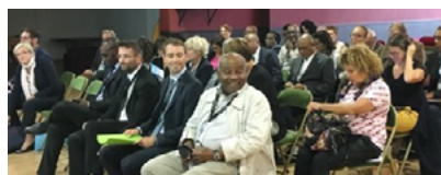
2019, Journées Interco' Outre-mer sur le territoire d'Ardennes Métropole