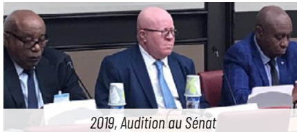
2019, Audition au Sénat