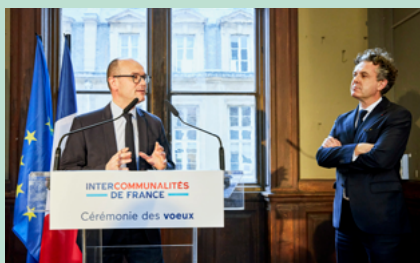
Voeux 2024 Intercommunalités au CNAM à Paris

Voeux du Président d'Intercommunalité de France