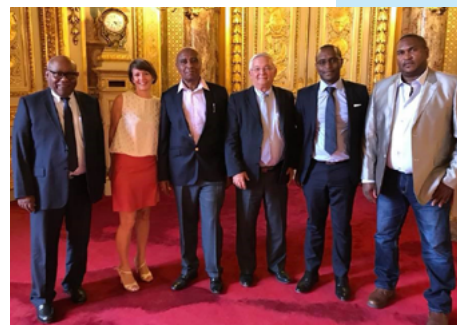
2018, Audition au Sénat