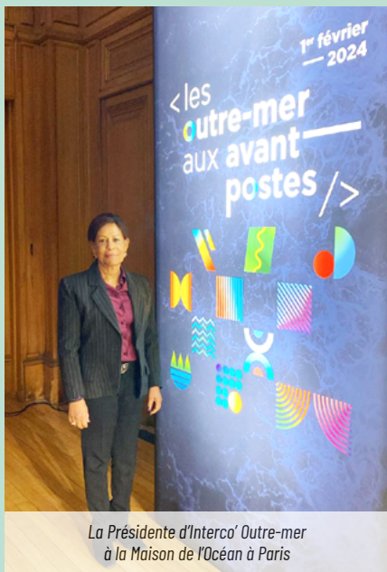
La Présidente d'Interco' Outre-mer à la Maison de l'Océan à Paris