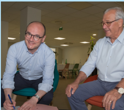
Signature de la convention partenariale entre Intercommunalités de France et Interco' Outre-mer

Il en faudra bien encore, de l'ambition, pour affronter les grandes transitions à l'œuvre dans nos territoires.