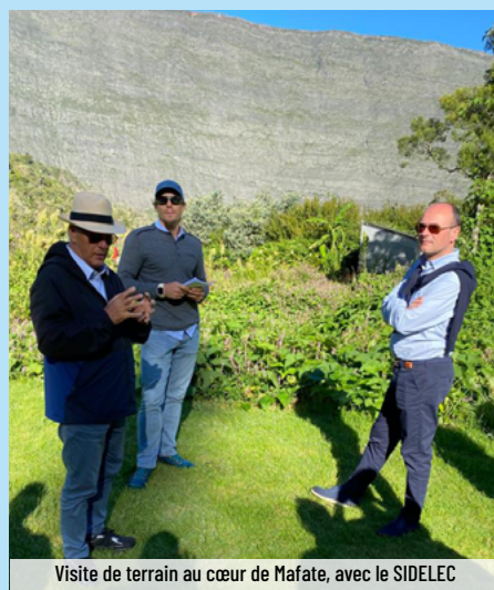
Visite de terrain au cœur de Mafate, avec le SIDELEC