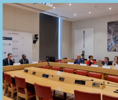
Intercô Outre-mer auditionnée par la Délégation sénatoriale aux Outre-mer