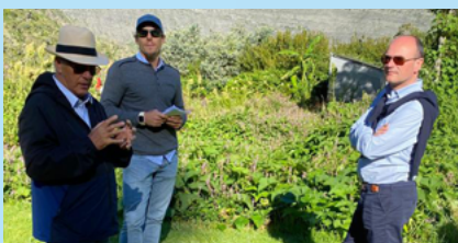
Visite de terrain au cœur de Mafate, avec le SIDELEC