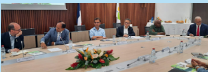
Le président du TCO accueille les délégations

Ces transitions sont un enjeu vital et exigent la mobilisation de chacun. C'est une question de conviction, une question politique, et tout l'enjeu du prochain Congrès d'Intercommunalités de France qui se tiendra à Orléans les 11, 12 et 13 octobre. J'aurai plaisir à y retrouver les intercommunalités ultra-marines car leur contribution à nos débats y sera essentielle.