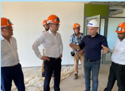
Visite de la Technopole sur le territoire de la CADEMA