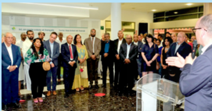
Discours du président d'Intercommunalités de France à l'inauguration de la Marianne Noire